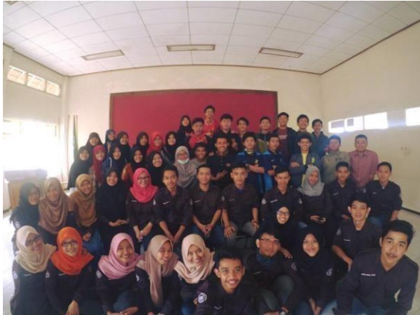
Gambar 10.1. Kegiatan Upgrading Himasepta