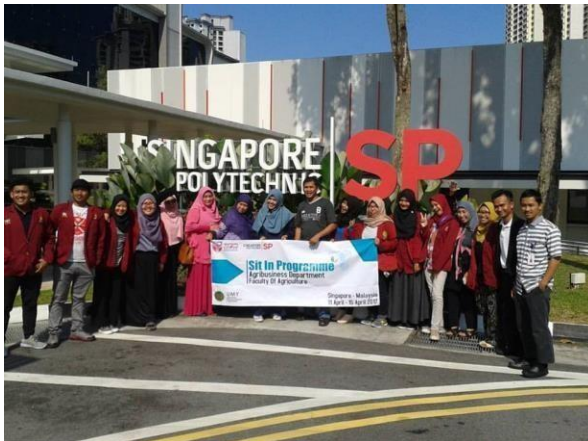
Gambar 8.5. Program Internasional di Singapore Polytechnic