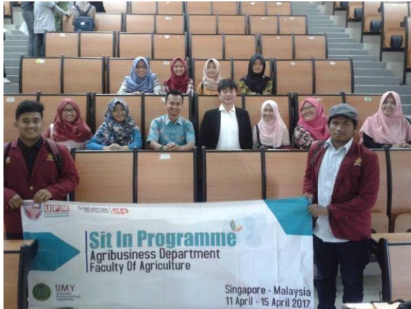
Gambar 8.6. Program Internasional di Universiti Putra Malaysia