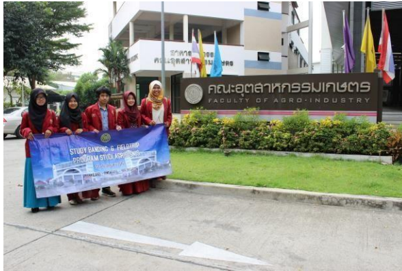
Gambar 8.1. Studi Banding dan Fieldtrip Internasional di Kasetsart University, Thailand

Program Studi Agribisnis juga memiliki program magang internasional. Program ini memberikan kesempatan kepada mahasiswa untuk dapat mengikuti perkuliahan di Universiti Putra Malaysia (UPM). Program ini dibuka untuk mahasiswa semester 6 dengan persyaratan mengikuti seleksi yang dilakukan oleh tim seleksi program studi.