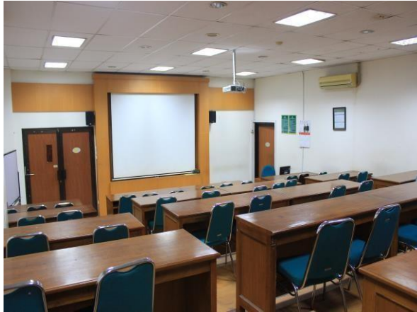
Gambar 7.3. Laboratorium Komunikasi