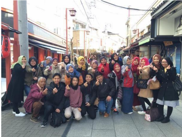
Gambar 8.4. Supervisi Magang Internasional di Niigata, Jepang