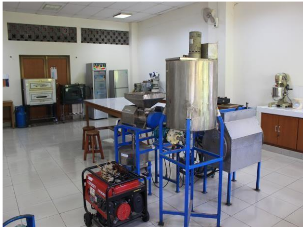
Gambar 7.2. Laboratorium Agribisnis