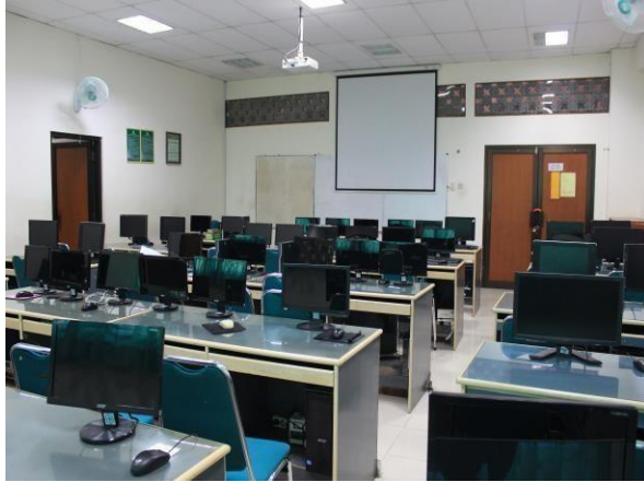
Gambar 7.1. Laboratorium Analisis