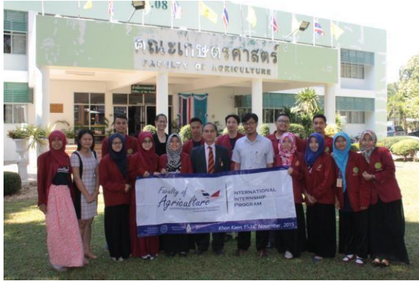
Gambar 8.2. Program Magang Internasional di Khon Kaen University, Thailand