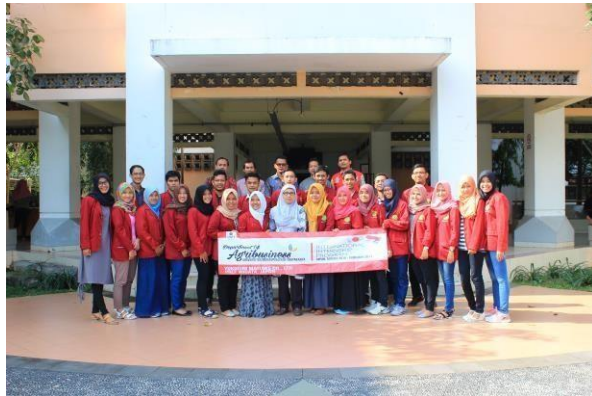
Gambar 8.3. Mahasiswa Agribisnis Peserta Magang Internasional Ke Yukiguni Maitake, Co. Ltd., Jepang.